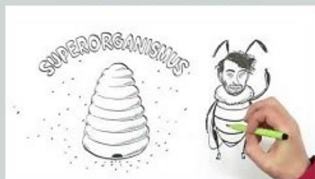
↑↑ Metodický list - Včely↑↑