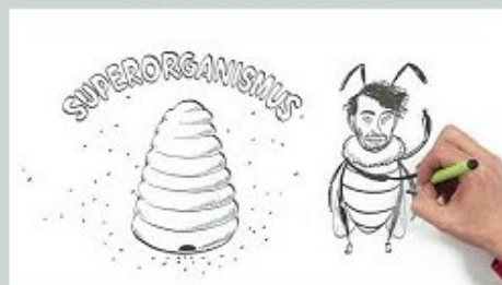
↑↑ Metodický list - Včely↑↑