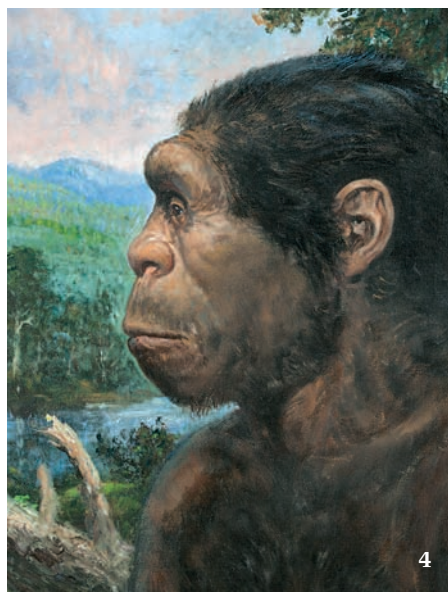
1 Fylogenetické vztahy recentních lidoopů a člověka 2 Zjednodušené evoluční schéma znázorňující fylogenetické vztahy druhů homininů (blíže v textu) a recentních lidoopů. Orig. M. Chumchalová (obr. 1 a 2), upraveno podle různých zdrojů 3 Neandertálcí ( Homo neanderthalensis ) představují jednu ze sesterských linií anatomicky moderního člověka, nikoli jeho předka. 4 Člověk vzpřímený ( Homo erectus ) se jako první známý hominin rozšířil z Afriky do Eurasie.

udělat určitou představu o genetických vztazích denisovců k neandertálcům i moderním lidem. Na řadu otázek si ale odpovědi stále jen domýšlíme. Prakticky nic netušíme např. o příčinách vymizení neandertálců přibližně před 30 tisíci let. Z četných nálezů víme, že neandertálcí zcela jistě vyráběli poměrně komplikované nástroje a ozdoby, uměli rozdělovat oheň, dokázali se postarat o staré a nemocné jedince a pohřbívali své mrtvé. Pohřbívání je od nich doloženo dokonce dříve než u druhu H. sapiens , z doby přibližně před 100 tisíci let. Neandertálcí zřejmě již